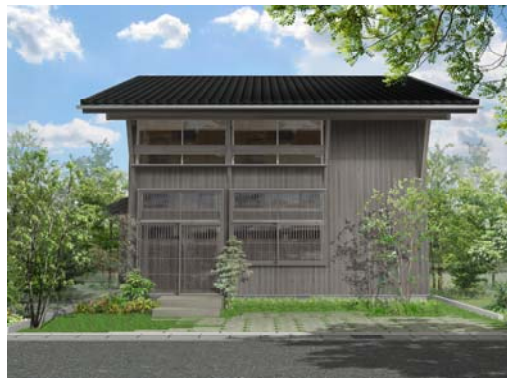
「KURA NINE」の内観(左)・外観(右)