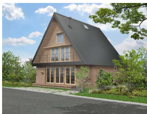
「KURA LOFT」の内観(左)・外観(右)