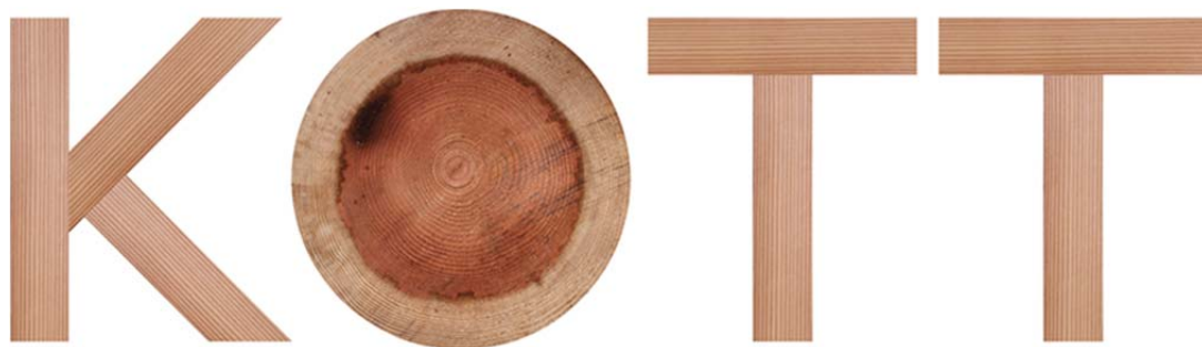
KOTT ロゴ（デザイン: グラフィックデザイナー 古平正義氏）

また、2017年初旬に「KOTT」を体感できる宿泊施設を鎌倉にオープンする予定です。（予約制）商品、サービスの詳細については、「KOTT」ブランドサイト kott.jp をご参照ください。