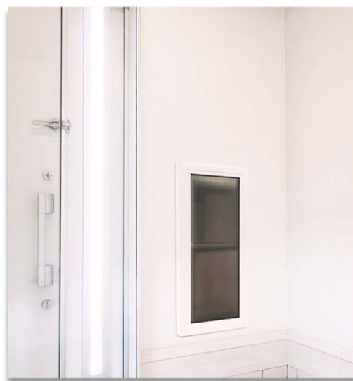
玄関内 受取側イメージ