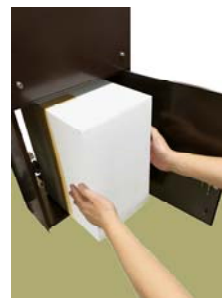
宅配ボックス投入口