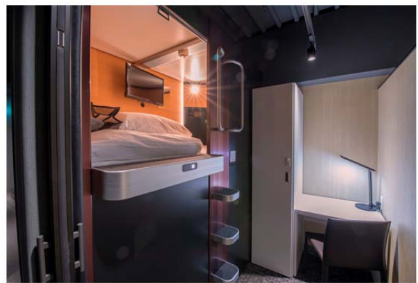
デスクも備えた キャビン型ルーム