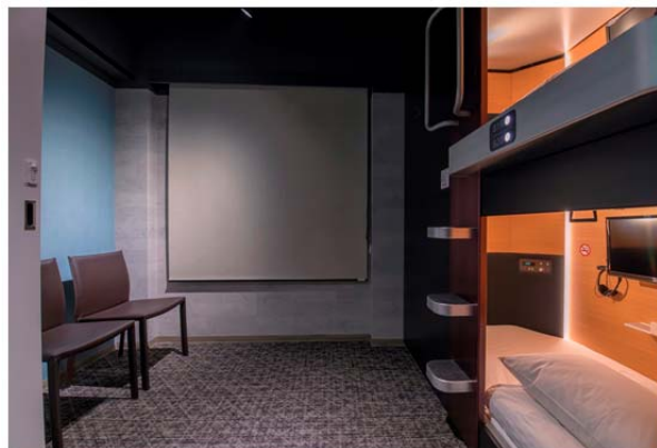
上下2段式の コンパクトキャビンタイプ

施設、サービスの詳細については、タマキャビン大阪本町 公式サイト https://tamahotels.jp/tamacabin-osaka-honmachi をご参照ください