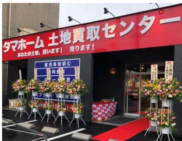
土地買取センター 岐阜店 外観